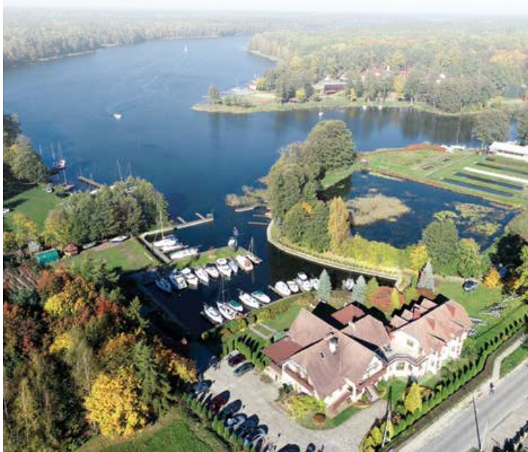
Na pierwszym planie port pensjonatu Janus, na lewo od niego pomost portu U Leśniczego. W głębi jezioro Bełdany

dostajemy dostęp do WC, umywalki, stanowiska do mycia naczyń oraz wody pitnej i prądu (na kei).