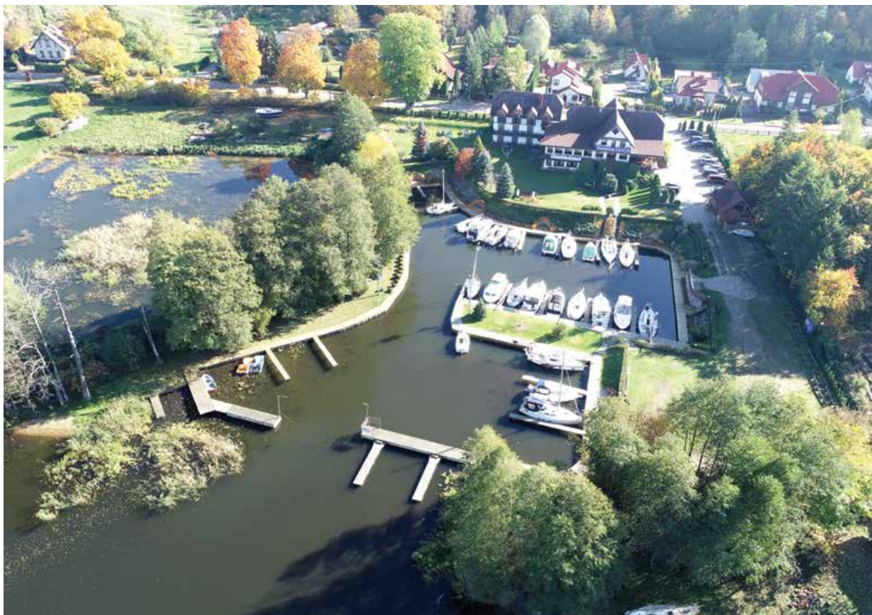
Port pensjonatu Janus

Około 40 m od portu U Leśniczego znajduje się sympatyczny kameralny port pensjonatu Janus. To ostatnia przed służą Guzianka przystań na południowo-zachodnim brzegu jeziora Bełdany. Chociaż zmieści się tu ok. 40 jachtów, większość miejsc zajmują rezydenci, a tylko kilka stanowisk przeznaczonych jest dla gości. Jednak aby móc tutaj zacumować, należy wcześniej zadzwonić i zarezerwować miejsce. Łatwo tu trafić, z wody widać budynek pensjonatu z dużym napisem „Restauracja”. Nie trzeba podnosić miecza przy podchodzeniu, głębokość w porcie wynosi 1,5 m. Stajemy longside przy poprzecznym pirsie, w miejscu wskazanym przez obsługę przystani. Port jest dobrze oświetlony i monitorowany 24 godziny na dobę. W ramach opłaty portowej skorzysta-