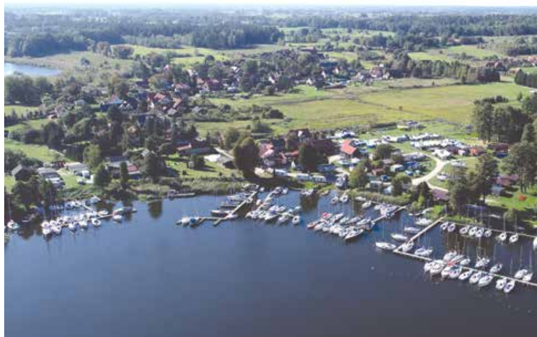
Port U Adama (po lewej) sąsiaduje z portem U Edka

Mijamy wejście do (zamkniętego szlabanami) Letniego Ogródku i po przepłynięciu ok. 70 m w kierunku zachodnim możemy zacumować w przystani U Adama. Jest tu głęboko, przy pomostach ok. 3–2 m, zmieści się 80 jednostek, ale większość miejsc zajmują rezydenci. Stajemy dziobem / rufą do pomostu i na bojce. W opłatę portową wliczone są: WC, możliwość pozmywania naczyń, dostęp do umywalki, a także woda i prąd na kei. Możemy też zostawić śmieci. Za prysznic trzeba zapłacić osobno. Na piaszczystym brzegu możemy wyslipować jacht, a na trawie rozstawić