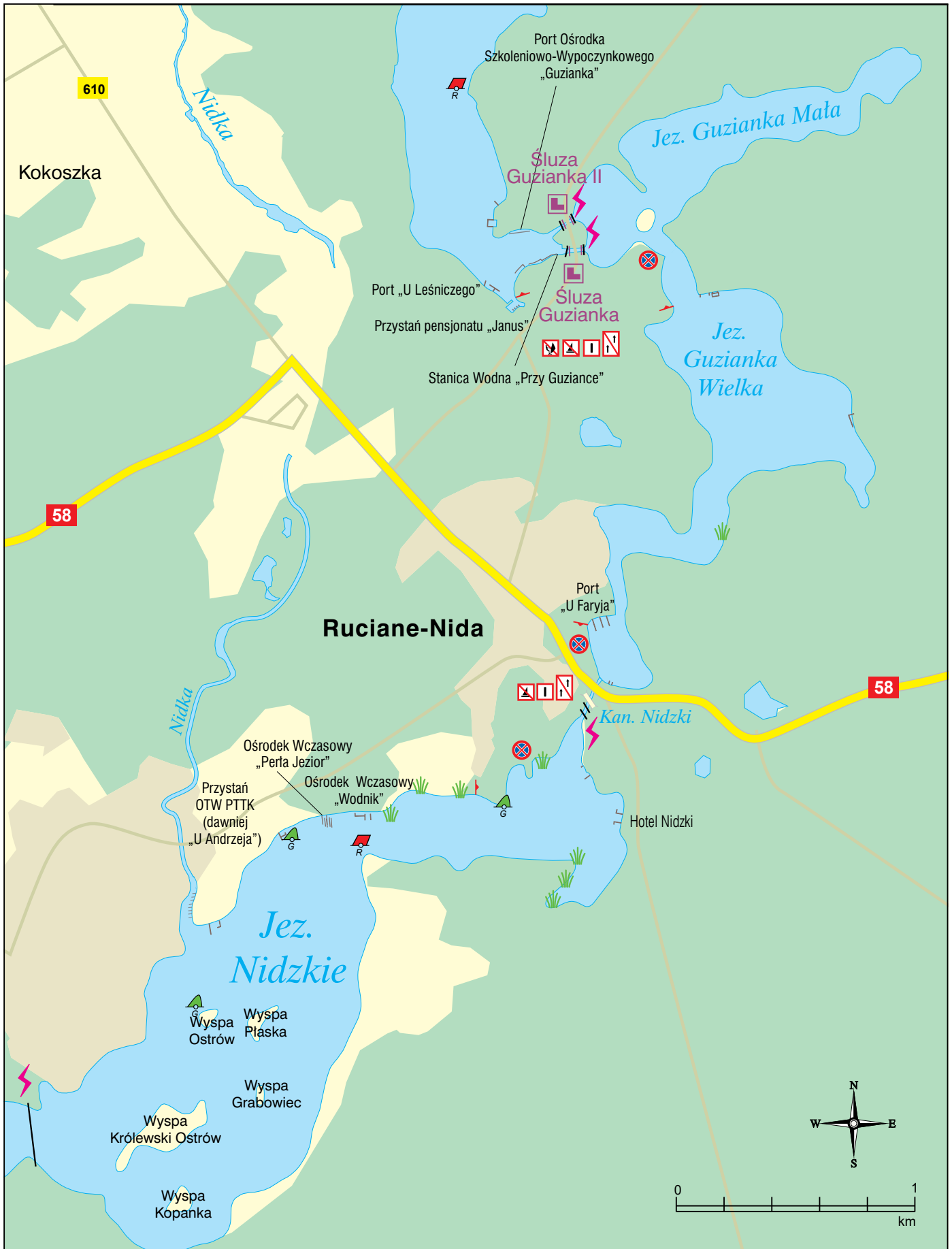
JEZIORA GUZIANKA MAŁA I GUZIANKA WIELKA ORAZ PÓŁNOCNA CZĘŚĆ JEZIORA NIDZKIEGO