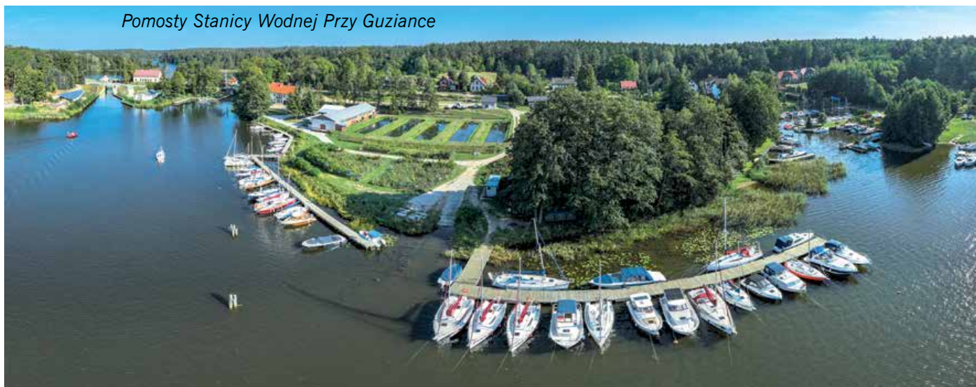
Pomosty Stacji Wodnej Przy Guziance