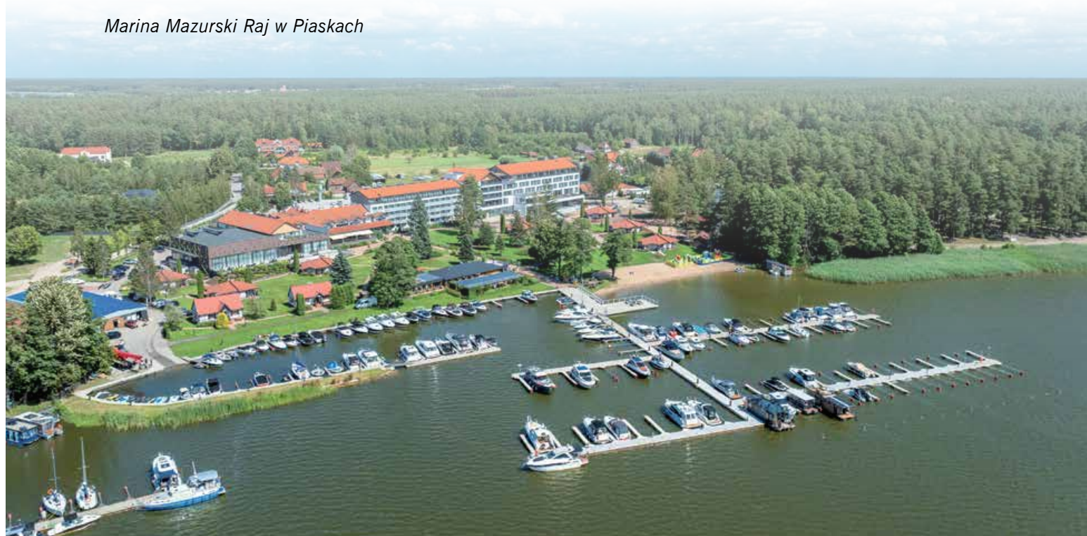
Marina Mazurski Raj w Piaskach

Tuż obok Korektywy, (patrząc z wody) po prawej stronie, stoją pomosty mariny Mazurski