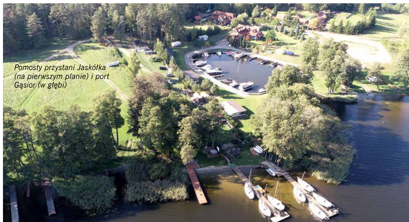
Pomosty przystani Jaskółka (na pierwszym planie) i port Gąsior (w głębi)

Żeglując z przystani Jaskółka kursem 154°, po 500 m dopływamy do stojących w zatoce czterech pomostów Klubu Miła Kamień. Dwa z nich są zarezerwowane dla jachtów rezydenckich, trzeci dla firmy czarterowej, a czwarty dla gości. Jeśli z Jaskółki popłyniemy kursem 143°, to po 900 m na prawym