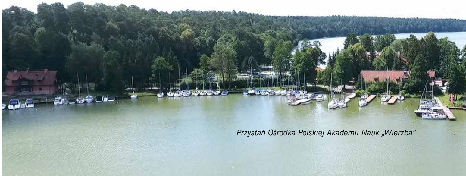
Przystań Ośrodka Polskiej Akademii Nauk „Wierzba”

Żeglując od strony jeziora Śniardwy, przechodzimy Przeczkę, trzymając się farwateru (uwaga na sieci!), mijamy lewą burtą stojący na cyplu Popielskiego Rogu słup z sygnalizacją burzową (53°45,895'N 21°37,230'E) i przy zielonej boi bramki farwaterowej bierzemy kurs 257°, którym płyniemy ok. 600 m. Jesteśmy w tym momencie już na jeziorze Bełdany. Przy czerwonej boi farwaterowej (53°45,894'N 21°36,631'E) przekładamy się na kurs 188°, którym żeglujemy ok. 900 m. Z wody widać pomalowany na żółto budynek pensjonatu i dwa pomosty: pierwszy (północny), wychodzący spomiędzy trzciny w kształcie odwróconej litery T, i drugi (południowy), na prawo od niego, za trzciny, równoległy do brzegu, którego pierwsza część także ma kształt litery L, a druga biegnie wzdłuż brzegu. Przy pomostach może w sumie zacumować 10–15 jachtów, głębokość od 2,5 m po