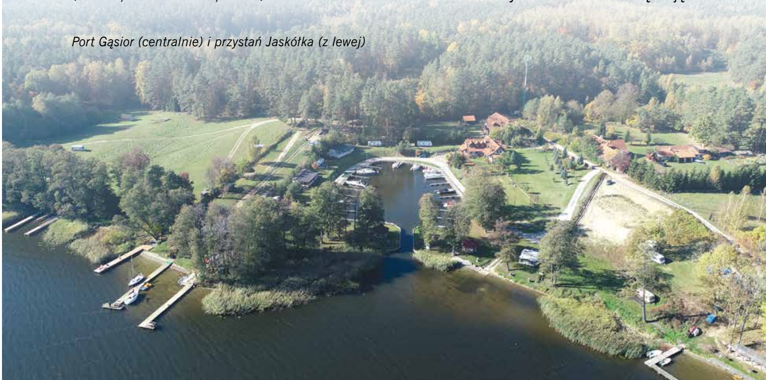
Port Gąsior (centralnie) i przystań Jaskółka (z lewej)

Kameralny, cichy, sympatyczny port, łatwo tu trafić. Płynąc prosto od Galindii, mamy do pokonania ok. 800 m kursem 237°. Jeśli natomiast żeglujemy od ujścia Krutyni, należy po prostu trzymać się zachodniego brzegu jeziora. Z daleka widać charakterystyczną wieżę telefonii komórkowej. Mając w odległości 5 m na lewym trawersie zieloną boję