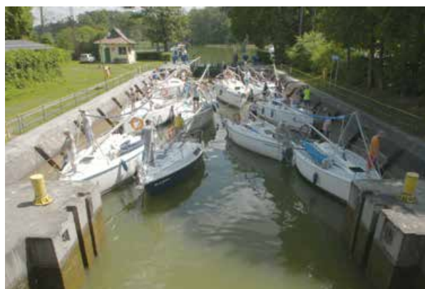
Śluza Guzianka w sezonie na ogół jest zatłoczona

Śluza powstała w 1879 r. i początkowo jej komora była wyłożona drewnem. Dwadzieścia lat później drewno zastąpiły ściany wykonane z kamieni i cegieł. W 2023 r. śluza przeszła remont kapitalny, a proces śluzowania został zautomatyzowany. Różnica poziomów wody to ok. 2 m. Śluza łączy jeziora Guzianka Mała, Guzianka Wielka i Jezioro Nidzkie ze szlakami prowadzącymi przez Bełdany na Śniardwy lub na Jezioro Mikołajskie, Tałty, Jezioro Ryńskie oraz dalej przez kanały na północ, aż do jeziora Mamry. W sezonie jest tu duży ruch i często trzeba poczekać w kolejce nawet kilkadziesiąt minut, bo niestety jachty muszą przepuszczać statki białej floty. Najszybciej prześluzujemy się wcześniej rano lub późnym popołudniem. Śluza ma długość 44 m, szerokość wrót