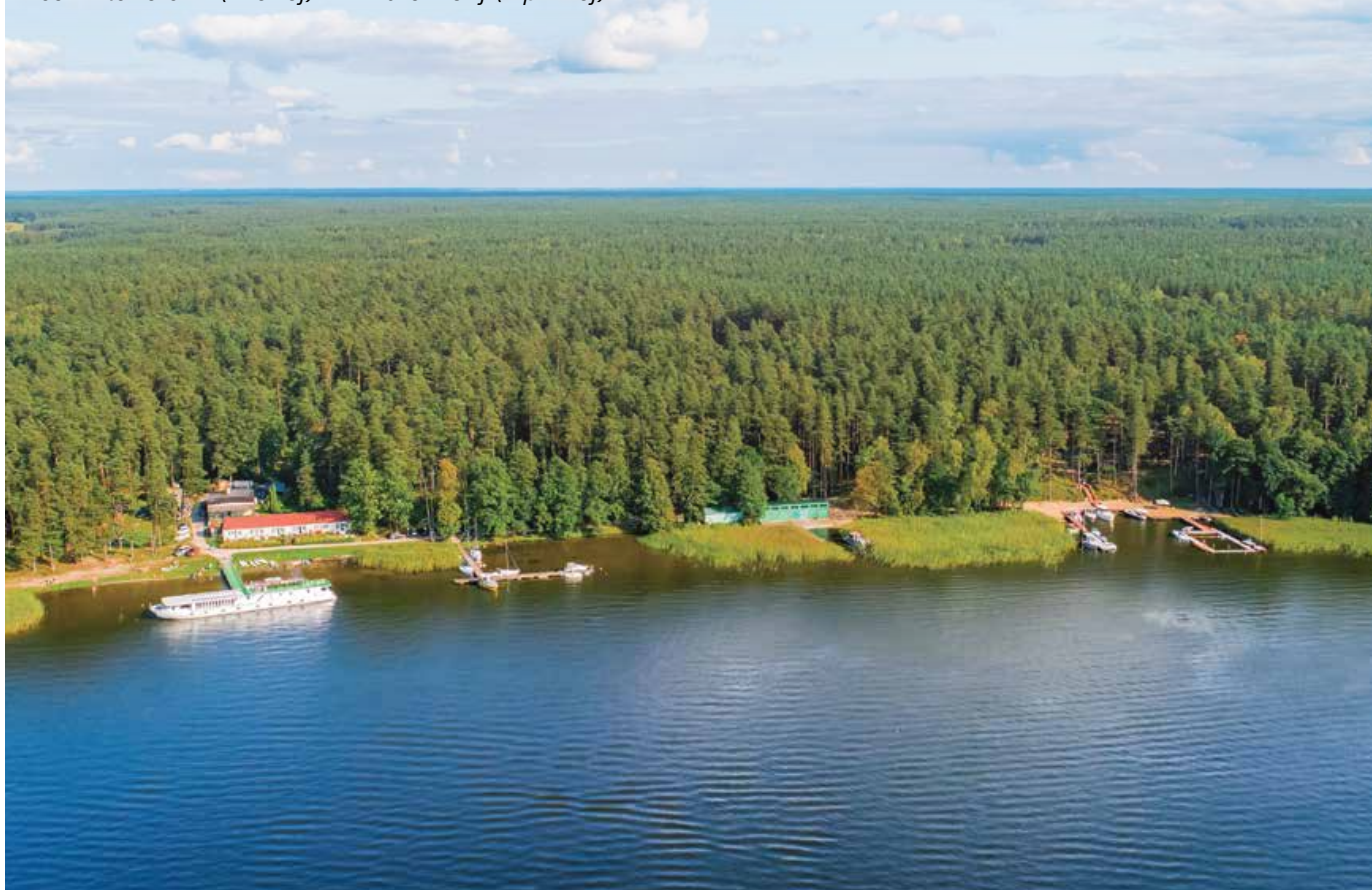
Wioska Rowerowa (z lewej) i Mazurski Gaj (z prawej)

W odległości ok. 300 m na południe od Mazurskiego Raju stoją dwa pomosty przystani o nazwie Wioska Rowerowa. Z wody widać stojący jakby między nimi, a w rzeczywistości na brzegu, biały budynek z czerwonym dachem. Przy pomoście pomalowanym na zielono często cumuje luksusowo wyposażony pasażerski statek MS „Classic Lady”. Jeśli komuś znudzi się żeglowanie, może kupić bilet i zwiedzać WJM na jego pokładzie :-). Jachty cumują na ogół przy drugim pomoście. W porcie jest ok. 60 stanowisk cumowniczych. Stajemy na murینگach, a miejsce wskazuje bosman. W ramach opłaty portowej (od jachtu) możemy korzystać z sanitariatów, zmywalni naczyń, wody pitnej (na kei), placu zabaw i plaży. Dodatkowo trzeba zapłacić za prysznic, prąd (na kei), opróżnienie chemicznej toalety jachtowej i za drewno na ognisko. Można tu dokonać drobnych napraw