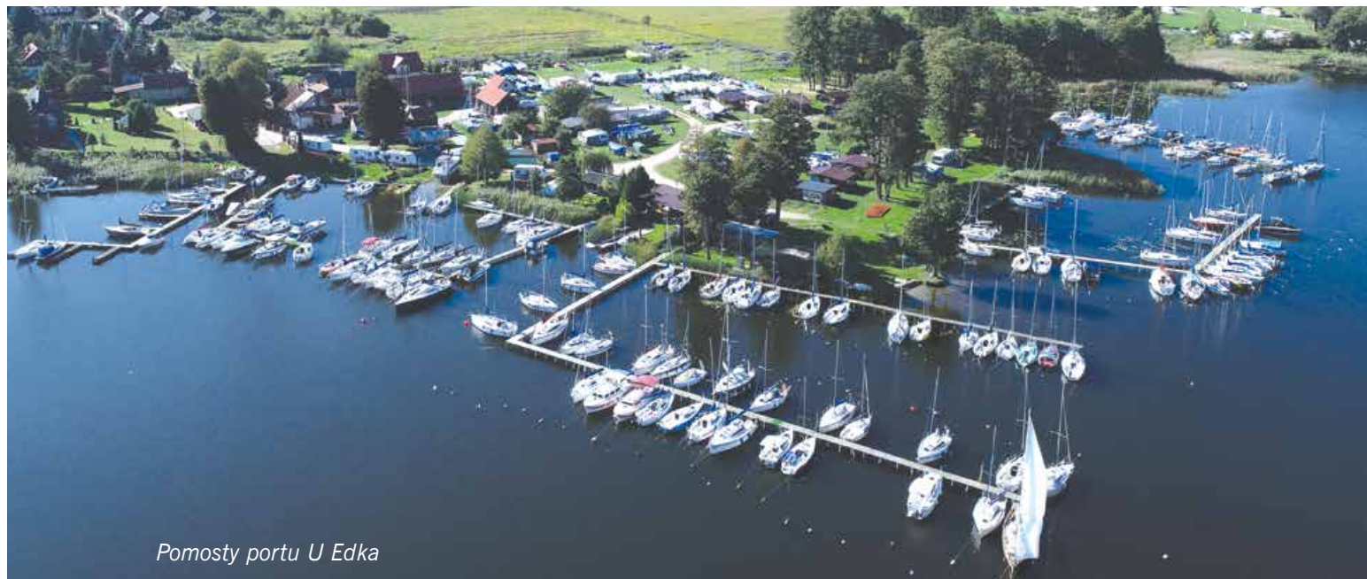
Pomosty portu U Edka

mieści się za cyplem. Głębokość przy kejach to ok. 1,5 m. Większość z 80 stanowisk zajmują jachty rezydentów. Miejsce postoju wskazuje bosman, u niego też płacimy (od osoby). Stajemy dziobem / rufą do pomostu i na boi. W ramach opłaty portowej zyskujemy dostęp do WC i umywalki, możemy pozmywać naczynia, zostawić śmieci, napełnić wodą zbiorniki jachtu. Osobno płacimy za prysznic (w automacie) i za prąd dostępny na kei, slip lub dźwig. Można ustawić grill, zjeść coś w barze lub smaźalni ryb, a także przezimować jacht. Na terenie portu jest pole namiotowe, można też wynająć pokój. Do sklepu spożywczego trzeba się przejść ok. 700 m do Wygryn. Jest tu również parking, a właściwie są to miejsca w alejkach na terenie portu, w większości zajęte przez samochody rezydentów.