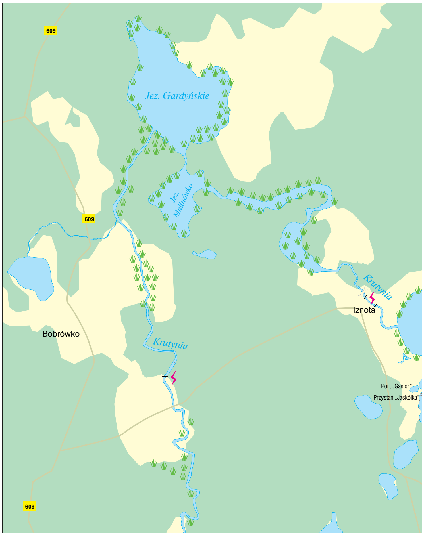
JEZIORO BEŁDANY (CZĘŚĆ PÓŁNOCNA)