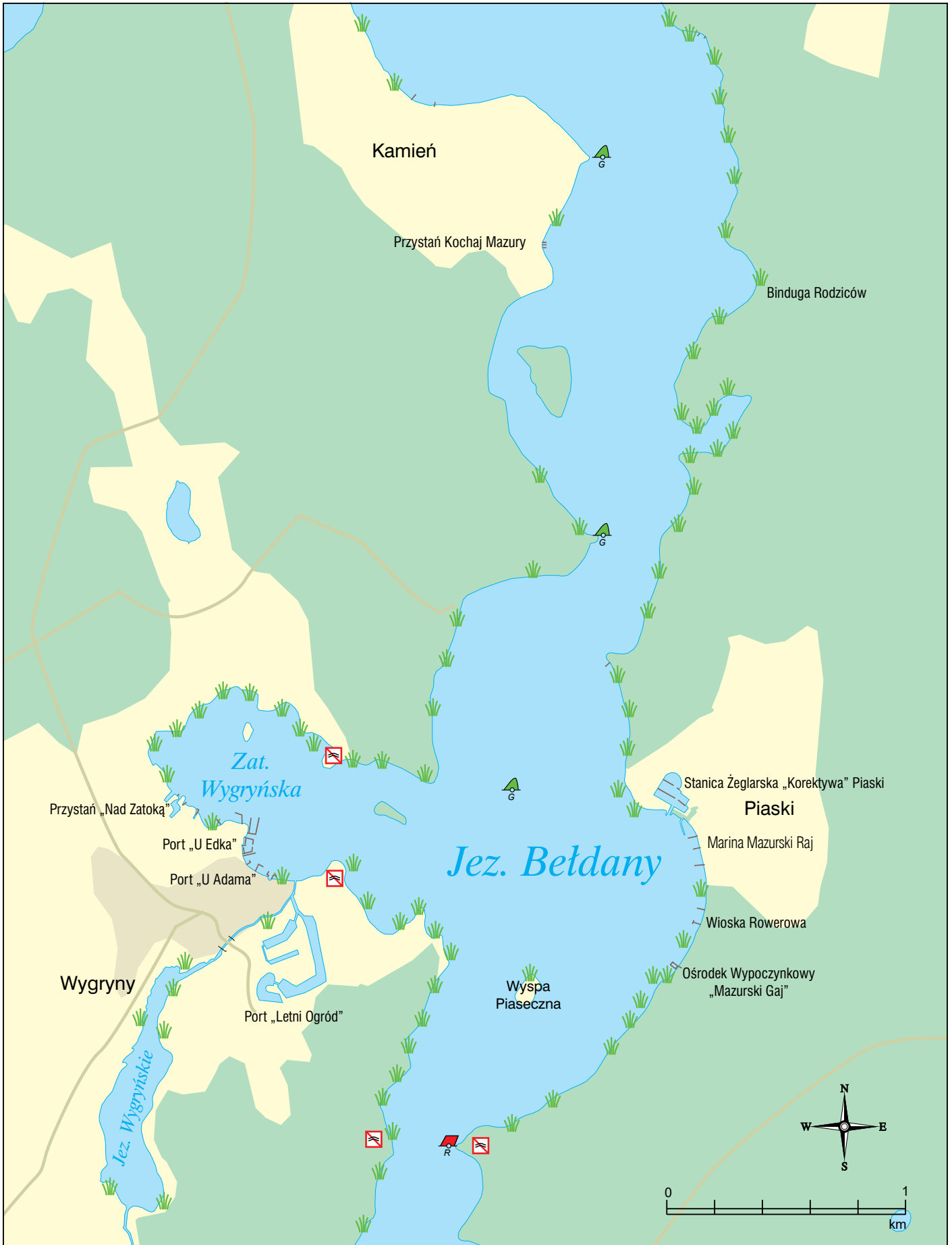
JEZIORO BEŁDANY (CZĘŚĆ POŁUDNIOWA)