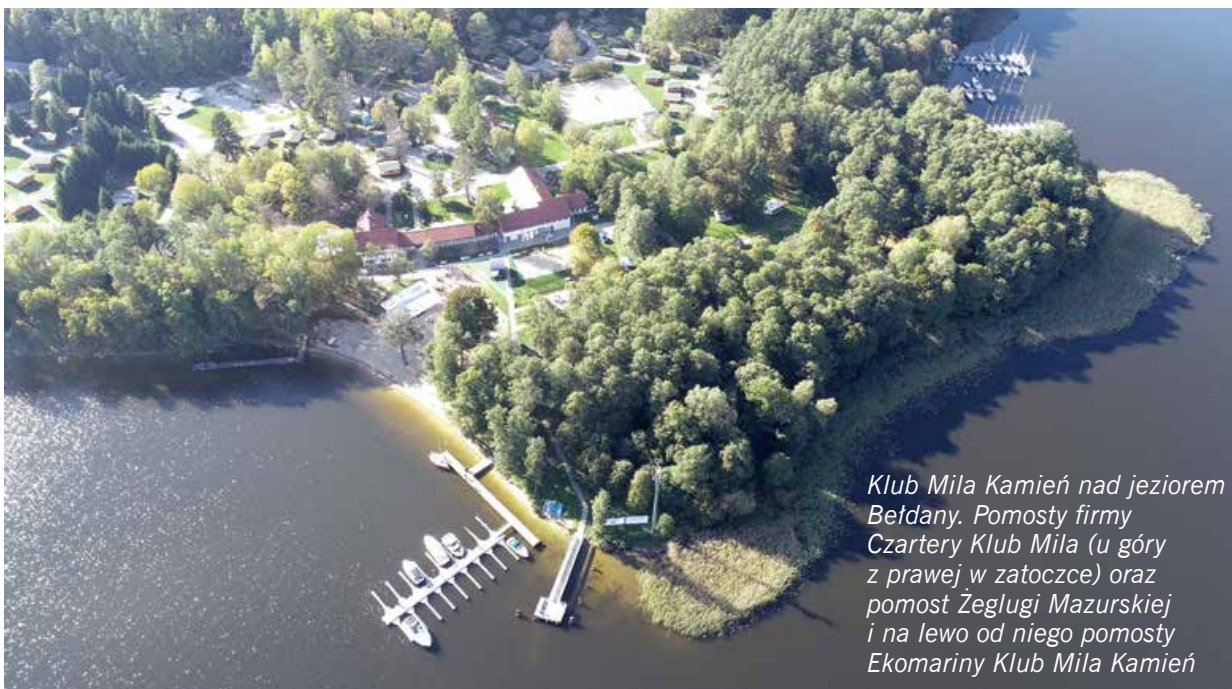
Klub Miła Kamień nad jeziorem Bełdany. Pomosty firmy Czartery Klub Miła (u góry z prawej w zatoczce) oraz pomost Żeglugi Mazurskiej i na lewo od niego pomosty Ekomariny Klub Miła Kamień

trawersie zobaczymy stojący na cyplu słup z sygnalizacją świetlną ostrzegającą przed silnym wiatrem (53°43,367'N 21°33,704'E). Tuż za nim zobaczymy pomost Żeglugi Mazurskiej (uwaga: nie próbujemy tam dobijać!), a następnie pomosty Klubu Miła Kamień: pierwszy wychodzący prostopadle od brzegu w jezioro, drugi trochę dalej, za kąpieliskiem, postawiony wzdłuż brzegu. Obowiązuje przy nich zakaz cumowania jachtów gości, ponieważ pierwszy należy do rezydentów, a przy drugim stoją jednostki wypożyczalni sprzętu wodnego. Cały port jest monitorowany. Za postój płacimy (od jachtu oraz od osoby) u bosmana w pawilonie mariny. W ramach opłaty dostajemy dostęp do sanitariatów oraz wody i prądu na kei. Dodatkowo trzeba zapłacić za prysznic, opróżnienie toalety chemicznej z jachtu, dźwig i slipowanie. Można tu dokonać drobnych napraw skutniczych (ceny do negocjacji z bosmanem), a także przemieścić jacht. Na terenie ośrodka znajdziemy bar i restaurację, boiska do siatkówki i koszykówki, plac zabaw, siłownię plenerową, mały park linowy, wypożyczalnię sprzętu pływającego i rowerów, strzeżone kąpielisko, dużą piaszczystą plażę z leżakami do dyspozycji gości i wygodny parking dla samochodów. W przyszłości będzie tu można skorzystać także z pralni i suszarni. W ośrodku można wynająć domki campingowe lub pokój w pa-