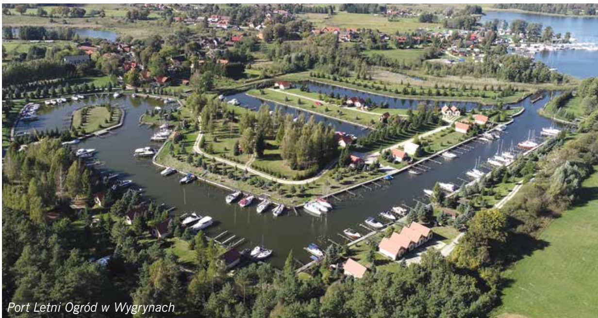
Port Letni Ogród w Wygrynach

szkutniczych i przezimować łódź. W pensjonacie jest restauracja. Sklep spożywczy 500 m od portu, w Wygrynach. Wieczorem można ustawić grill, rozpalić ognisko, a drewno do niego nabyć na miejscu. Cały teren portu jest ogrodzony i monitorowany 24 godziny na dobę. Można tu bezpiecznie zostawić samochód, a nawet... helikopter, bo w Letnim Ogródku jest także specjalnie wyznaczone miejsce na lądowisko.